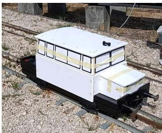
La carrosserie est réalisée à partir de plaque PVC de parois de douche