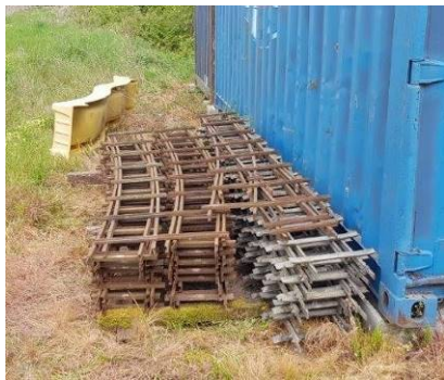
- Le circuit portable en 7-1/4''